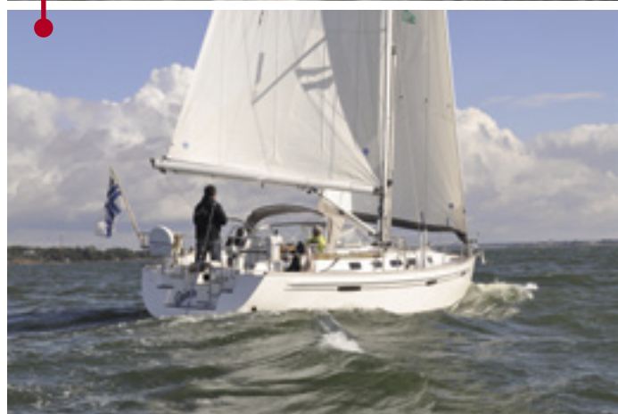
Tehon ja kevyen hallittavuuden tuntu kutsuvat merelle. > Saaren ohjaaminen oli ilo myös myötätuulussa.